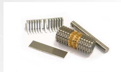
El rodillo y el peine se extraen en unos pocos segundos para una limpieza efectiva.