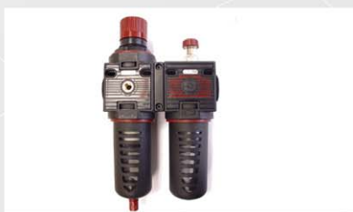
El grupo de filtro de aire de 1/2" asegura la máxima higiene.