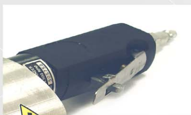
El cuerpo cuadrangular del motor en termoplástico ofrece un agarre seguro sin resbalones, además de ligereza e higiene.