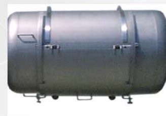
Tapa deslizable de gran abertura, compatible con elevadores standard, y descarga sobre carro.