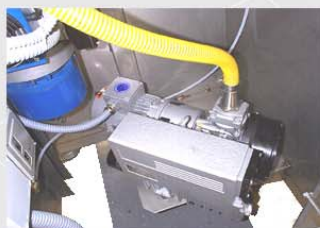
Bomba de vacío BUSCH programable desde pantalla táctil.