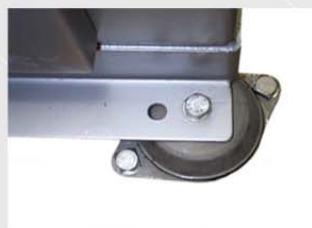
Las patas con silent blocks integrados evitan las vibraciones y permiten anclar la máquina al suelo.