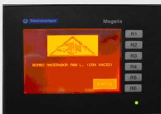
Tiempo, sentido de giro y vacío programable desde pantalla táctil con memorias de programas.