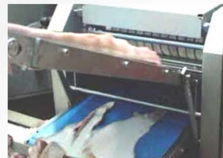
La tercera cinta de salida corteza, opcional, aumenta la versatilidad en cadenas en serie.