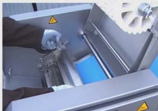
La extracción fácil y rápida del portacuchillas minimiza los tiempos de cambio de cuchilla.