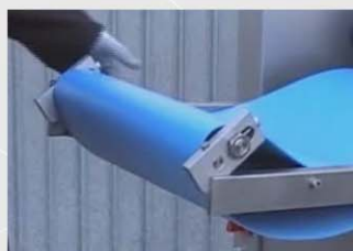
El fácil desmontaje de las bandas sin herramientas, facilita el mantenimiento y la limpieza