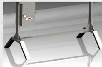
Base adaptada para una altura de trabajo hergonómica.