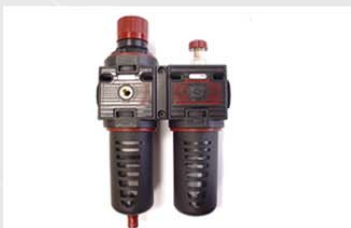
Filtro de autolubricado de purga automática, incluido.